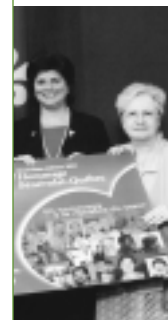
Présentant l'affiche officielle de la 4 e édition de l'HBQ, la présidente de la FCABQ en compagnie de la ministre déléguée à la Lutte contre la pauvreté et l'exclusion, M me Nicole Léger.

La FCABQ est heureuse de s'associer au Secrétariat à l'action communautaire autonome du Québec dans un processus qui vise à reconnaître, souligner et remercier des individus, jeunes et moins jeunes, ainsi que des organismes qui contribuent indéniablement à l'amélioration de la qualité des milieux de vie de nos communautés.